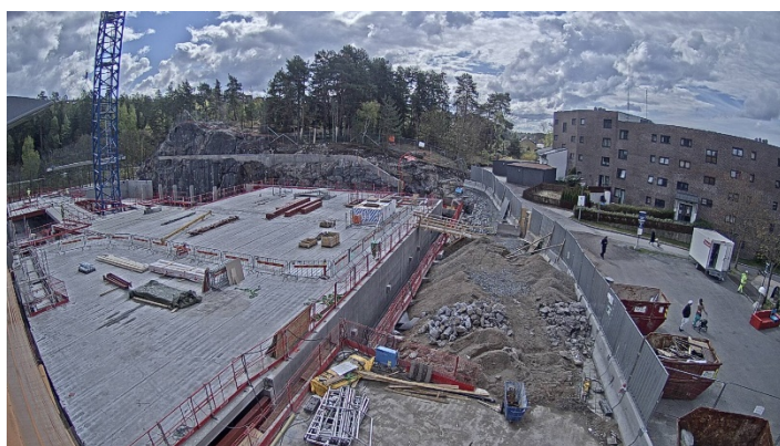
Bilder er tatt av byggeplassen den 30.04.2020