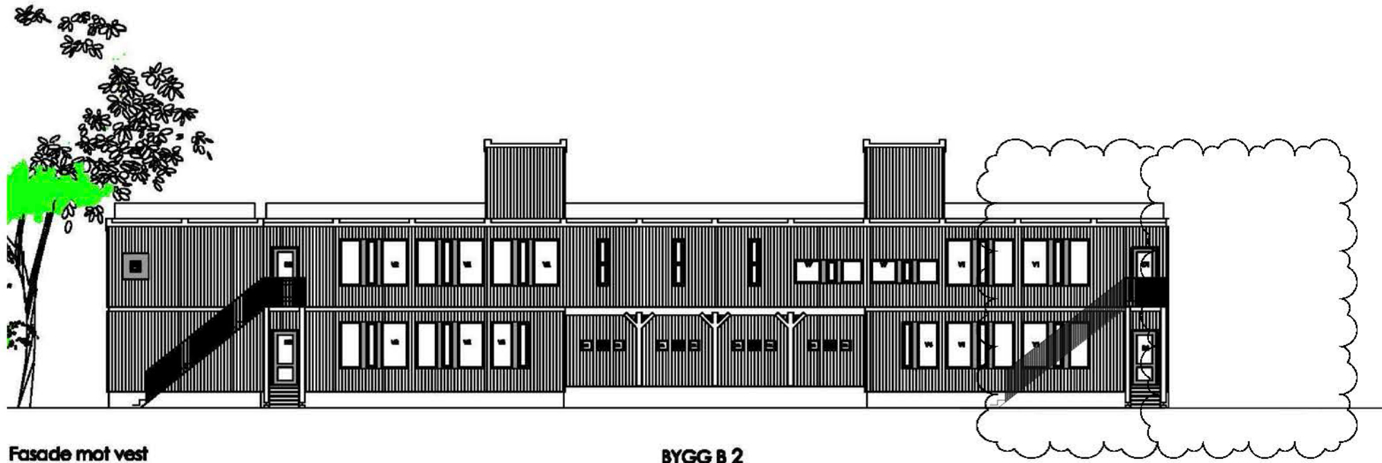
Fasade mot vest