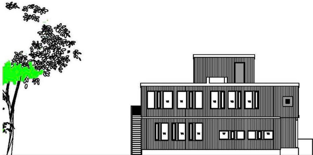
BYGG B2 Fasade mot syd